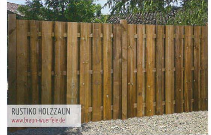
RUSTIKO HOLZZAUN www.braun-wuerfele.de