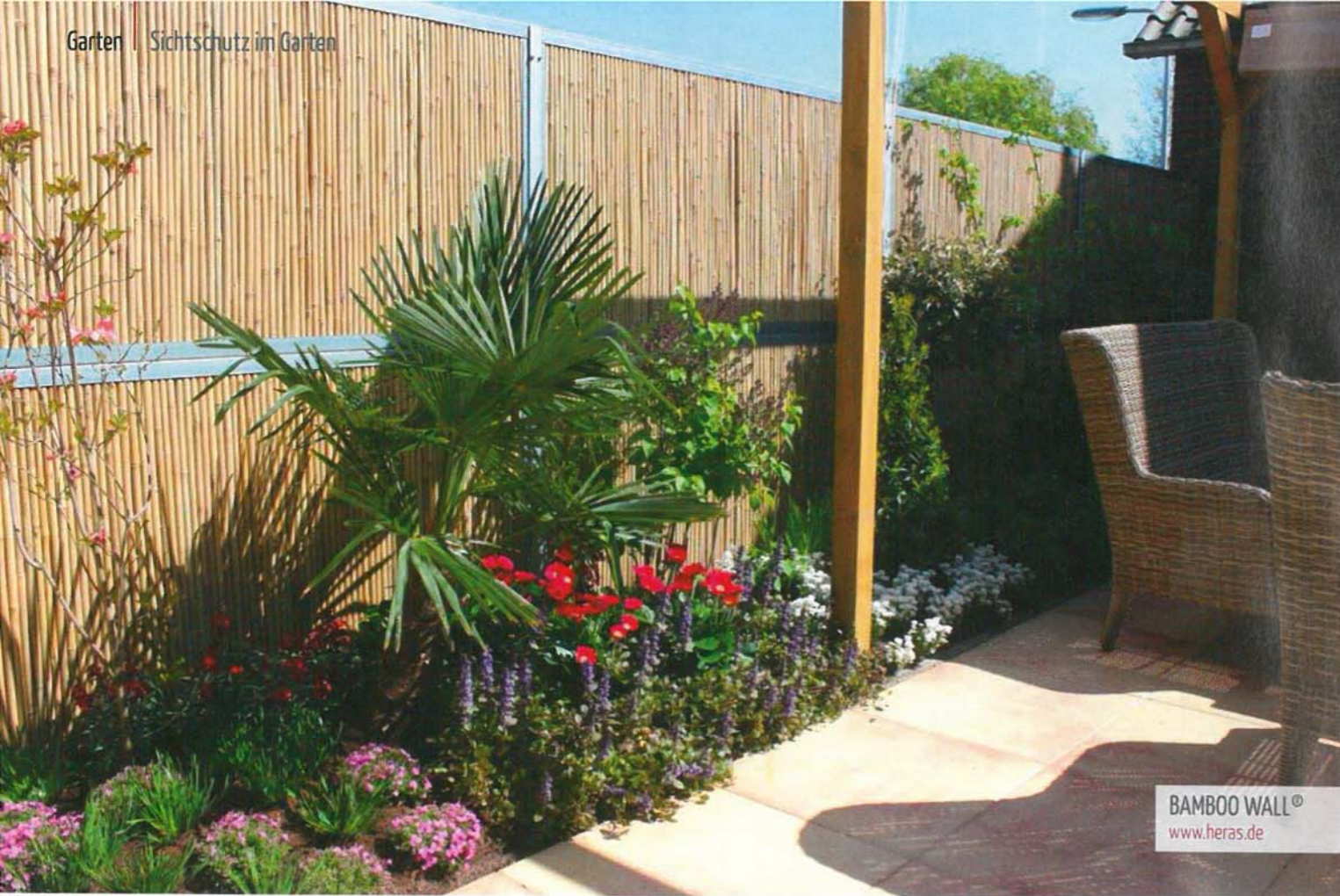
BAMBOO WALL® www.heras.de