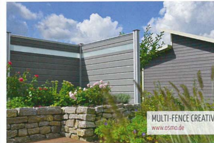
MULTI-FENCE CREATIV www.osmo.de