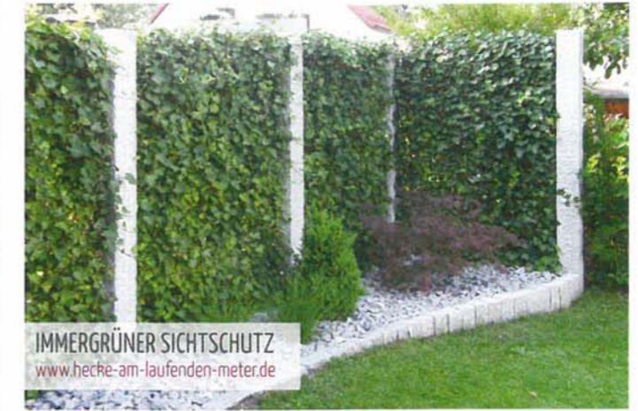
IMMERGRÜNER SICHTSCHUTZ www.hecke-am-laufenden-meter.de