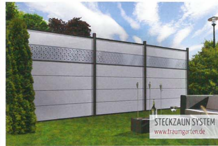
STECKZAUN SYSTEM www.traumgarten.de